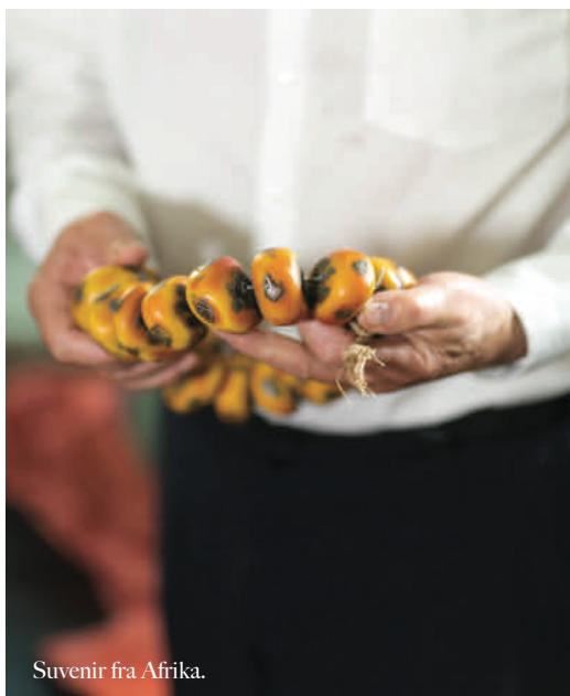
Suvenir fra Afrika.