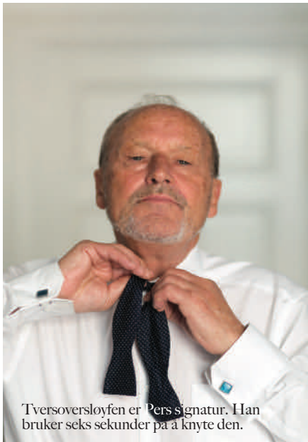
Tversoversløyfen er Pers signatur. Han bruker seks sekunder på å knyte den.