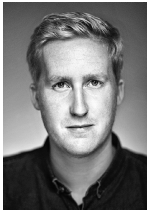
Fotograf Bjørn Wad ønsker å skape bilder ▲ som får den som betrakter, til å føle noe.

Til daglig jobber han som profesjonell portrettfotograf i brytningsfeltet mellom kommersiell foto og kunstfoto. Prosjektet «Family Portraits» ble i fjor utstilt på Rådhusplassen i Oslo. Prosjektet fullføres i løpet av 2017 og blir trolig en bok i 2018. Wad har gitt Vern om Livet tillatelse til å trykke noen av bildene fra prosjektet. ●