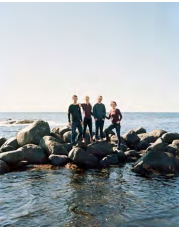
Belland, Tromøya 2014