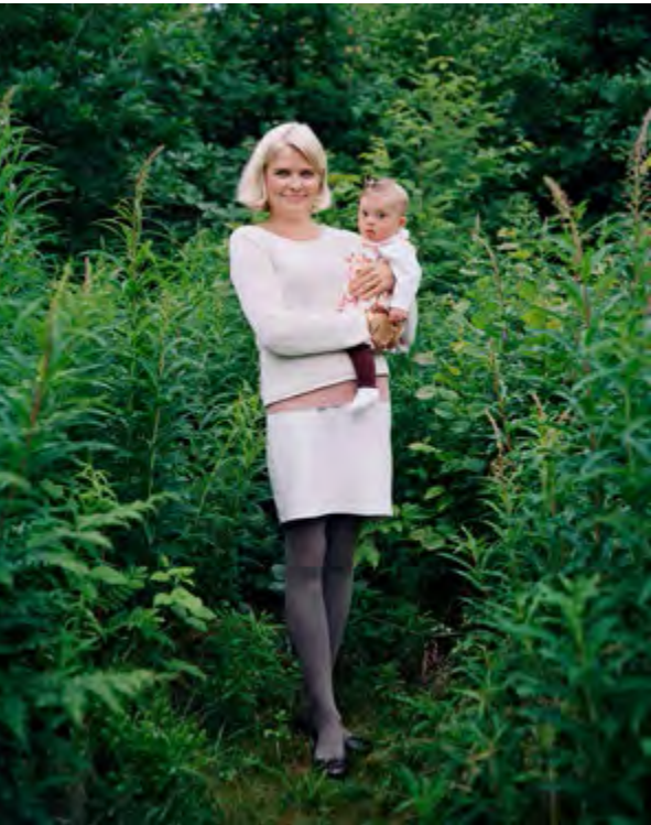
Grimsbø, Grimstad 2013