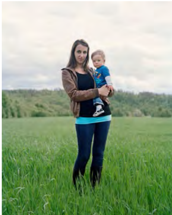
Geisler, Stigen, Ås 2013