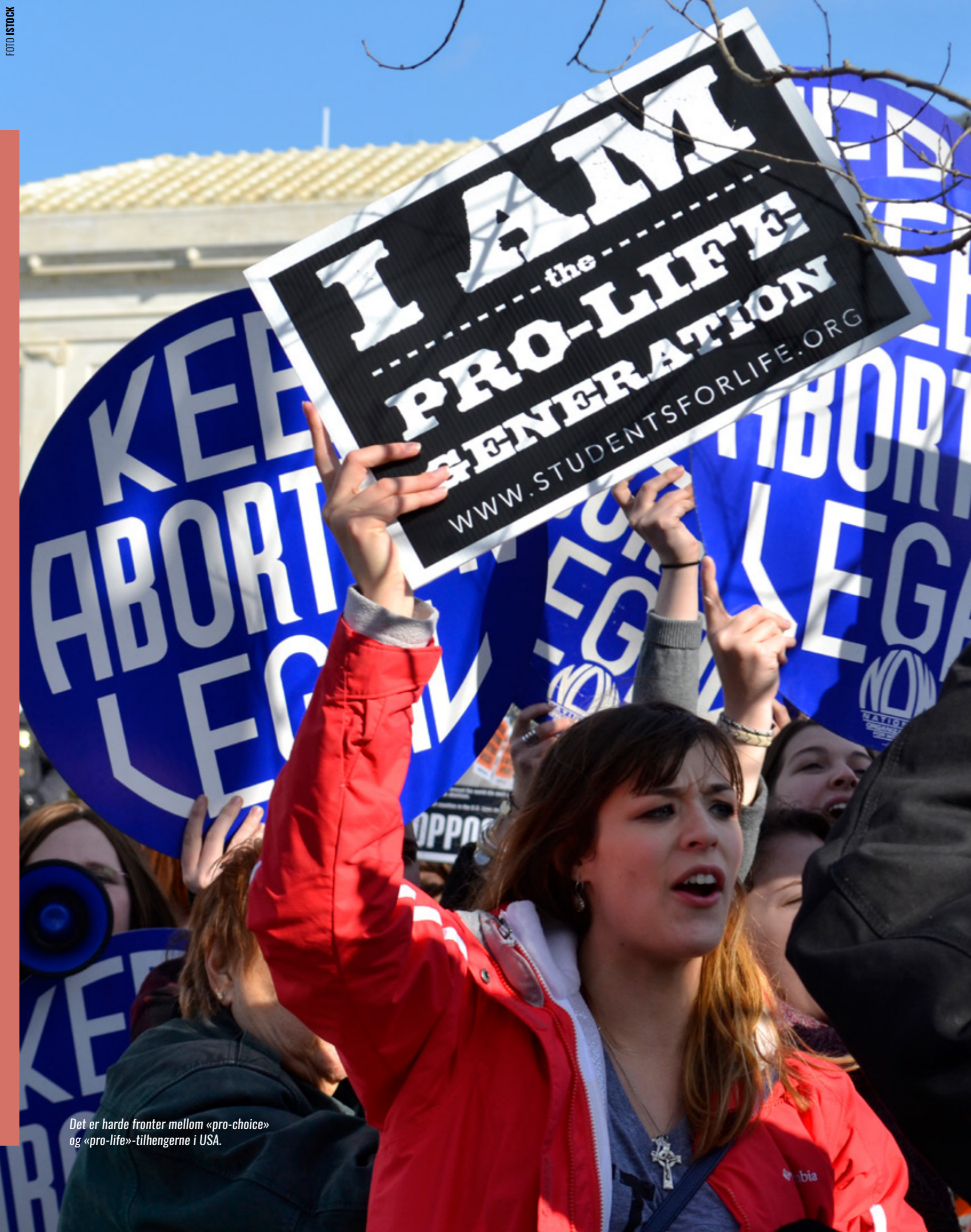
Det er harde fronter mellom «pro-choice» og «pro-life»-tilhengerne i USA.