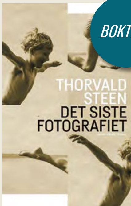
Det siste fotografiet ble gitt ut på Forlaget Oktober høsten 2019.

Moren har løyet for ham hele livet. Hun har ikke fortalt at bestefaren og onkelen hans hadde den samme muskelsykdommen som han har. Hvorfor var det så viktig for moren å tie om dette?